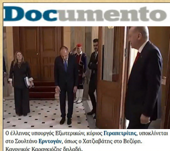
Ο έλληνας υπουργός Εξωτερικών, κ.Γεραπετρίτης, υποκλίνεται στο Σουλτάνο Ἐρντογάν, όπως ο Χατζωβάνης στο Βεζύρη. Κωνσταντίνος Κωνσταντίνους διλόγι.